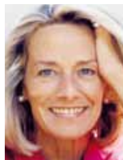
Prof. Dr. Gertrud Höhler

Rolf Schweiger Rolf Schweiger studierte Jurisprudenz an der Universität Zürich und schloss die akademische Ausbildung im Jahr 1969 mit dem Lizentiat ab. Im Jahr 1971 erwarb er das Zuger Anwaltspatent und nahm seine Tätigkeit als Anwalt und Notar auf. Rolf Schweiger ist Mitglied verschiedener Verwaltungsräte. Im Jahr 2004 war er Präsident der FDP Schweiz. Rolf Schweiger wurde im Alter von 24 Jahren in den Zuger Kantonsrat gewählt, welchem er mit einem Unterbruch während 22 Jahren angehörte, davon 14 Jahre als Fraktionschef der FDP. Rolf Schweiger vertritt seit 1999 den Kanton Zug im Ständerat.